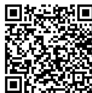
แบบสำรวจออนไลน์