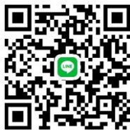
กลุ่มไลน์ Pulse Survey