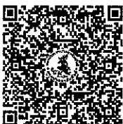
ใบสมัครฯ

จึงเรียนมาเพื่อโปรดมอบหมายผู้เกี่ยวข้องดำเนินการต่อไปด้วย