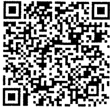
QR Code ใบสมัคร