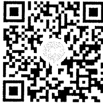
QR Code ไลน์กลุ่ม