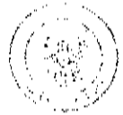
(นายกิตติพงษ์ โพธิ์) อธิบดีกรมพลศึกษา