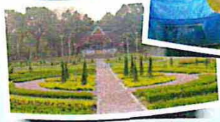
ศูนย์ศึกษาการพัฒนาเขาค้อ