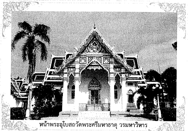
หน้าพระอุโบสถวัดพระศรีมหาธาตุ วรมหาวิหาร

โดยร่วมทำบุญได้ที่ สำนักบริหารกลาง โทร. ๐๑๙๐๔ และ ๐๑๙๑๔