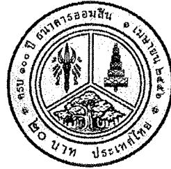
ด้านหลัง