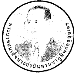
ด้านหน้า