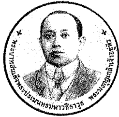
ด้านหน้า