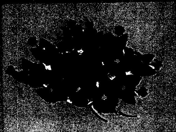
ดอกบานชื่น สัญลักษณ์วันเมตตาปัญญาอ่อน