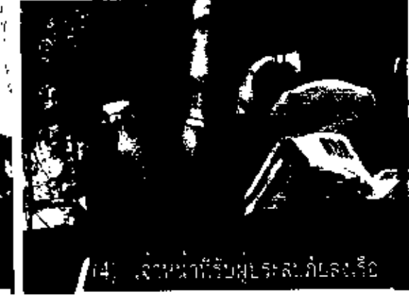
4. แจกหน้ากากที่รับผู้ประสบภัยลงเรือ