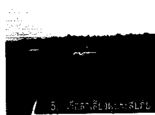
5. แจกน้ำดื่มแก่ผู้ประสบภัย