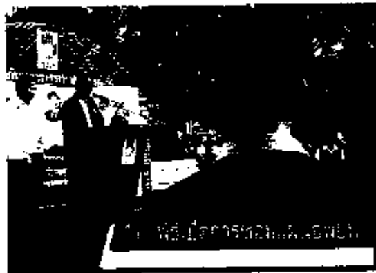
1. พิธีเปิดการช่วยเหลือผู้ประสบภัย