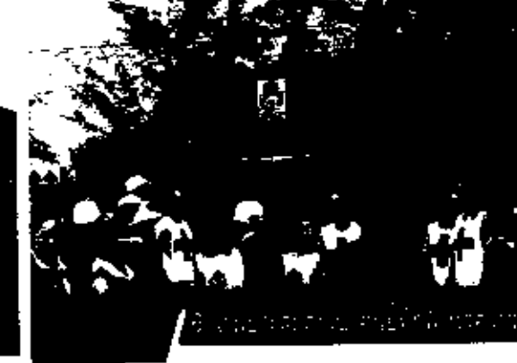
6. แจกน้ำดื่มแก่ผู้ประสบภัย