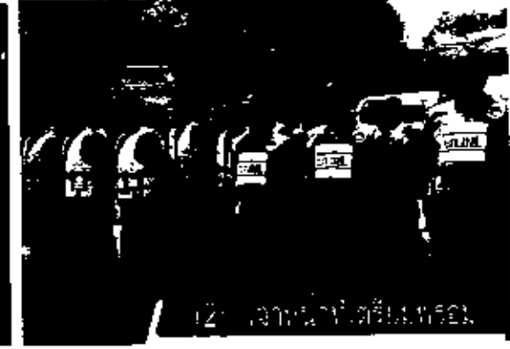
2. แจกน้ำดื่มที่ศูนย์อพยพ