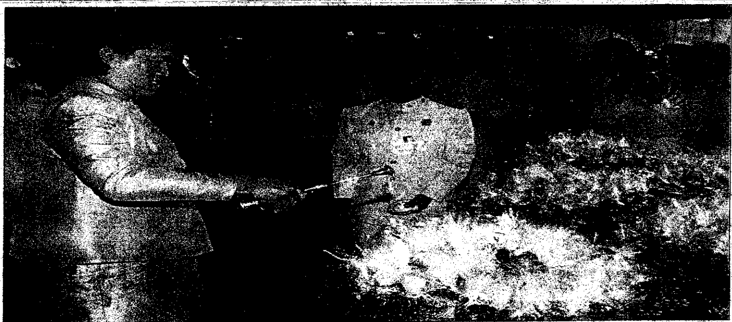
สมเด็จพระนางเจ้าสิริกิติ์ พระบรมราชินีนาถ เสด็จฯ ไปทรงเปิดงาน พิธีถือน้ำพระพิพัฒน์ฯ ที่วัดอรุณราชวราราม กรุงเทพมหานคร เมื่อวันที่ ๒๕ เมษายน ๒๕๕๐ ณ มณฑลพิธีท้องสนามหลวง โดยพระบาทสมเด็จพระเจ้าอยู่หัว ทรงร่วมพิธีด้วย