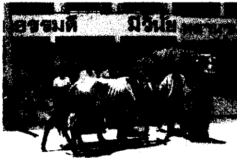
ภาพมอบโคแด่ โรงเรียนทับทิมสยาม 080.คลองหาด จ.สระแก้ว