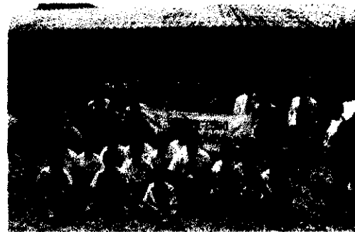
ภาพมอบโคแด่ โรงเรียนคลองไถ่เดือน อ.คลองหาด จ.สระแก้ว