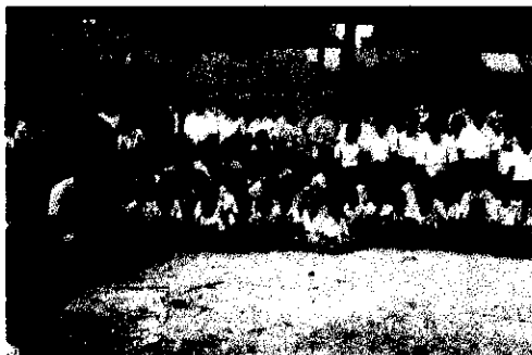
ภาพมอบโคแด่ โรงเรียนกองทัพภูปดิมภ์ อ.ตาพระยา จ.สระแก้ว