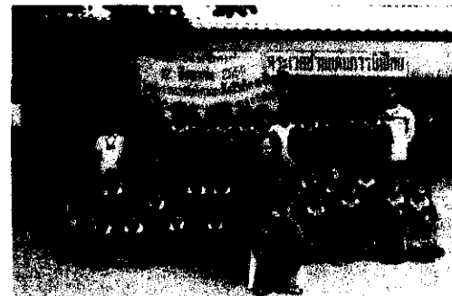
ภาพมอบโคแด่ โรงเรียนตำรวจตระเวนชายแดน อ.คลองหาด จ.สระแก้ว