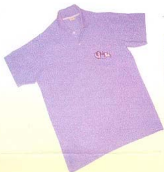
สุภาพบุรุษ