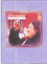
แผ่นคู่ แบบ 1 (12 บาท)