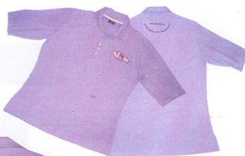
สุภาพสตรี