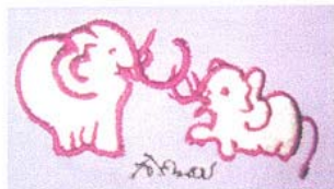
ภาพสีพระหัตถ์