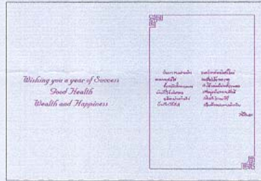
แผ่นเดี่ยว แบบ 2 (6 บาท)