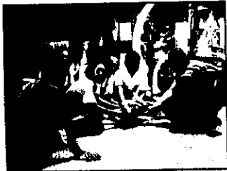
พิธีรับมอบมรดกสารจากวัดโสธรวาราม รวมท้าวหาร จังหวัดฉะเชิงเทรา