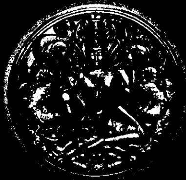
เนื้อมหาว่านดำ