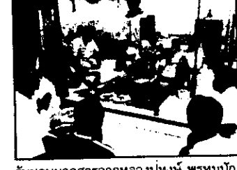
รับมอบมรดกสารจากหลวงปู่หงษ์ พรหมปัญญ จังหวัดสุรินทร์