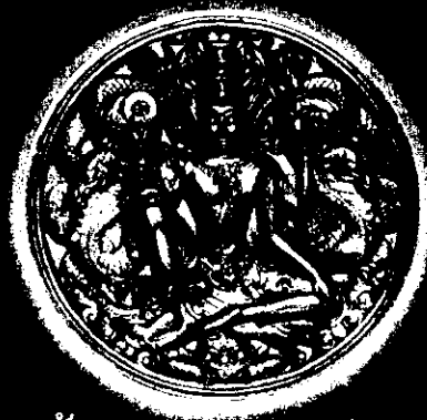
เนื้อผงดินเผาเคลือบเขียว