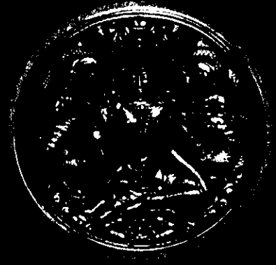
เนื้อมหาว่านแดง