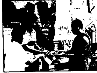
พิธีรับมอบมรดกสารจากวัดพระธาตุพนม รววิหาร จังหวัดนครพนม