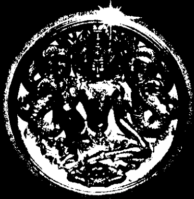
เนื้อมหาว่านขาวปัตทอง