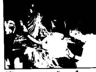
พิธีรับมอบมรดกสารจากวัดพระศรีมหาธาตุ รวมท้าวหาร จังหวัดพิษณุโลก