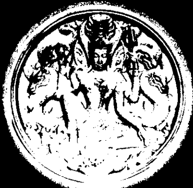
เนื้อมหาว่านขาว