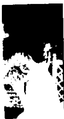
ระธาตุโดยสุเทพ

สิ่งของวัดตุ้มมงคลที่โต ชั้นวัดตุ้มมงคลที่นั้น