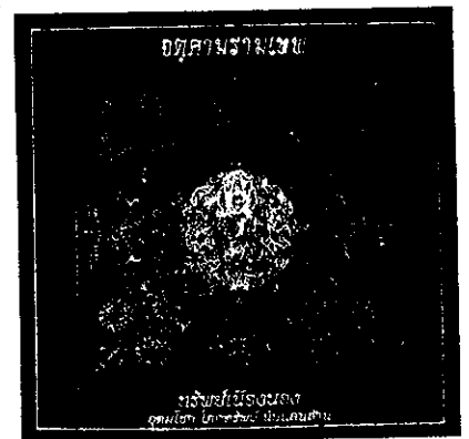
ผ้ายันต์ทำจากตุ๊กตารามเทพ สีแดง “ทรัพย์สินเมืองนอง” ปักดินทอง

๐-๗๗๔๑-๒๓๔๐ ๐-๗๗๔๑-๑๕๔๒ ๐-๗๗๔๑-๑๕๒๙ หรือ ๐๘-๑๐๘๖-๕๙๐๙