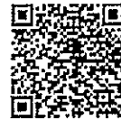
สเปคตบริษัทกลางฯ