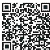
แจ้งรายชื่อผู้มีส่วนได้ส่วนเสีย