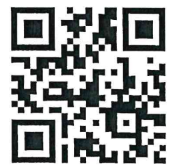
QR.CODE.วีดีทัศน์ ให้ความรู้เรื่องผักตบชวา